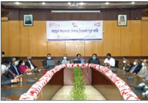
চিকিৎসা এককভাবে করা যায় না। মাল্টিডিসিপ্লিনারি এ্যাথ্রোচ ক্যান্সারের রোগীর সংখ্যা বৃদ্ধি প্ররুতি নিতে হবে। সরকারে আন্দোলন গড়ে তোলার মাধ্যমে